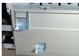
Paroi des rebords avec éléments grimpants