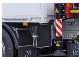
Support de plaque d'appui

Autres options et accessoires spécifiques sur demande.