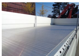
Arrimage de la charge NK-Fix