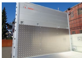
Paroi frontale robuste