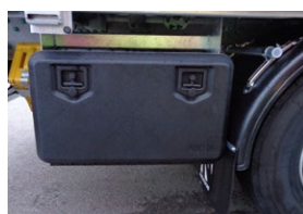
Caisse à outils en matière synthétique