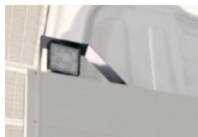
Projecteurs de travail LED