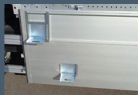
Hilfreiche Aufstiegstritte in den Bordwänden