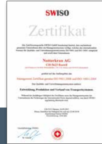
Notterkran ist mit seinem Qualitätsmanagement nach ISO 9001 und ISO 14001 zertifiziert.

Die komplette Fertigung bis zur Endmontage und Abnahme erfolgt in den Notterkran-eigenen Aufbaucentern. Hier finden Sie Spezialisten, die über die notwendige Erfahrung und Sorgfalt im Aufbau von Kranen verfügen. Unsere Aufbaucenter in Boswil, Aclens und Ebersbach sind mit einer hervorragenden technischen Ausrüstung ausgestattet, jährlich liefern wir mehr als 250 Fahrzeuge mit Kran- oder Hakengeräteaufbauten an Kunden in der Schweiz und auch dem europäischen Ausland aus.