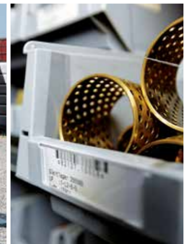
Am Ende ist ausschlaggebend, dass Fahrzeug und Gerät perfekt zusammenspielen, bei der Qualität keine Kompromisse gemacht wurden und die Lösung sich im harten Praxisalltag bewährt.