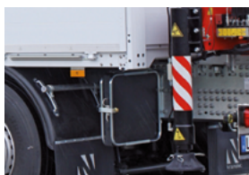
Support de plaque d'appui