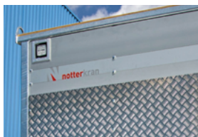
Projecteurs de travail LED