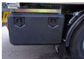
Caisse à outils en matière synthétique