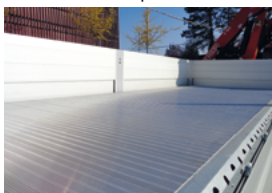
Profilé d'arrimage de la charge